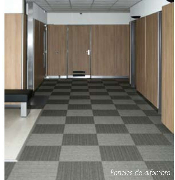
Paneles de alfombra